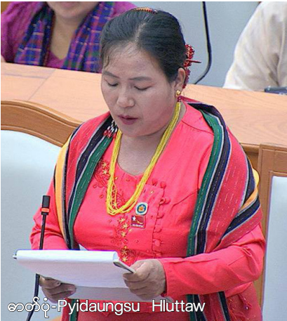
ခေါ်ထုတ်- Pyidaungsu Hluttaw