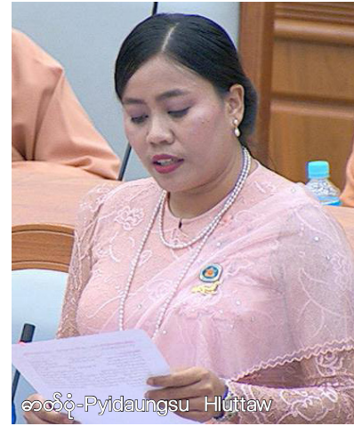
ခေါ်ထုတ်- Pyidaungsu Hluttaw

ဒီမိုကရေစီစနစ်ရဲ့အဓိကမဏ္ဍိုင်မှာ နိုင်ငံသားများရဲ့အခွင့်အရေးများနဲ့ တန်းတူရေးပဲဖြစ်ပါတယ်။ နိုင်ငံတော်သီချင်းမှာပါသလို တရားမျှတခြင်း၊ လွတ်လပ်ခြင်း၊ ငြိမ်းချမ်းခြင်း၊ တန်းတူညီမျှခြင်းတွေမရှိသမျှ ကာလပတ်လုံး ဒီတဝန်အရေးသုံးပါးဖြစ်တဲ့ ပြည်ထောင်စုမပြိုကွဲရေး၊ တိုင်းရင်းသားစည်းလုံးညီညွတ်မှု မပြိုကွဲရေး၊ အချုပ်အခြာအာဏာ တည်တံ့ခိုင်မြဲရေးဆိုတာ စာအုပ်ထဲမှာပဲရှိနေပြီးတော့ လက်တွေ့မြေပြင်မှာ ညီအစ်ကိုချင်း စစ်ခင်းနေရတာတွေ၊ အခွင့်အရေးတန်းတူညီမျှမှုမရှိတာတွေ စိတ်ဝမ်းကွဲပြားမှုတွေ အပြန်အလှန်သံသယတွေနဲ့ မငြိမ်းချမ်းမှုတွေသာရှိနေမှာ ဖြစ်ပါတယ်။ တိုင်းရင်းသားလူမျိုးများစွာနဲ့ တည်ဆောက်ထားတဲ့ ပြည်ထောင်စုမှာ တိုင်းရင်းသားလူမျိုးများ၏ ကိုယ်စားပြုပုံစံရှိမှုသာ ပြည့်စုံလုံလောက်မှာ ဖြစ်ပါတယ်။ ဒါကြောင့် လွှတ်တော်ထဲမှာရှိတဲ့အစုအဖွဲ့အားလုံး ပါဝင်နိုင်ရေးအတွက် ပြင်ဆင်ရေးပူးပေါင်းကော်မတီကို ပြည်ထောင်စု လွှတ်တော်ဥပဒေ နည်းဥပဒေများအရ ဖွဲ့စည်းပြီး ဆောင်ရွက်ခြင်းဖြစ်တဲ့အပြင် ပြည်ထောင်စုလွှတ်တော်ဆိုင်ရာဥပဒေ ပုဒ်မ ၈(ဃ) အရ နိုင်ငံသားများ၏ မူလအခွင့်အရေးများ ရရှိခံစားနိုင်ရေးကို ရှေးရှုပြီး ဆောင်ရွက်ခြင်းဖြစ်တဲ့အတွက် ကော်မတီမှ တင်သွင်းလာတဲ့ အစီရင်ခံစာပေါ်မှာ အလေးအနက်ထောက်ခံကြောင်း တင်ပြလိုပါတယ်။