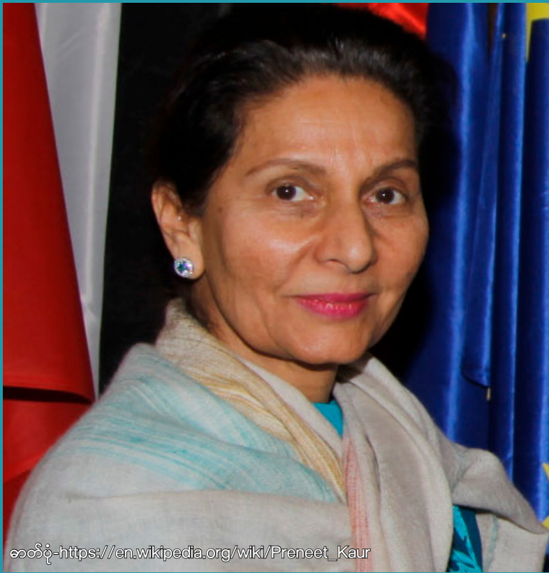
ခေါင်းပုံ- https://en.wikipedia.org/wiki/Preet_Kaur