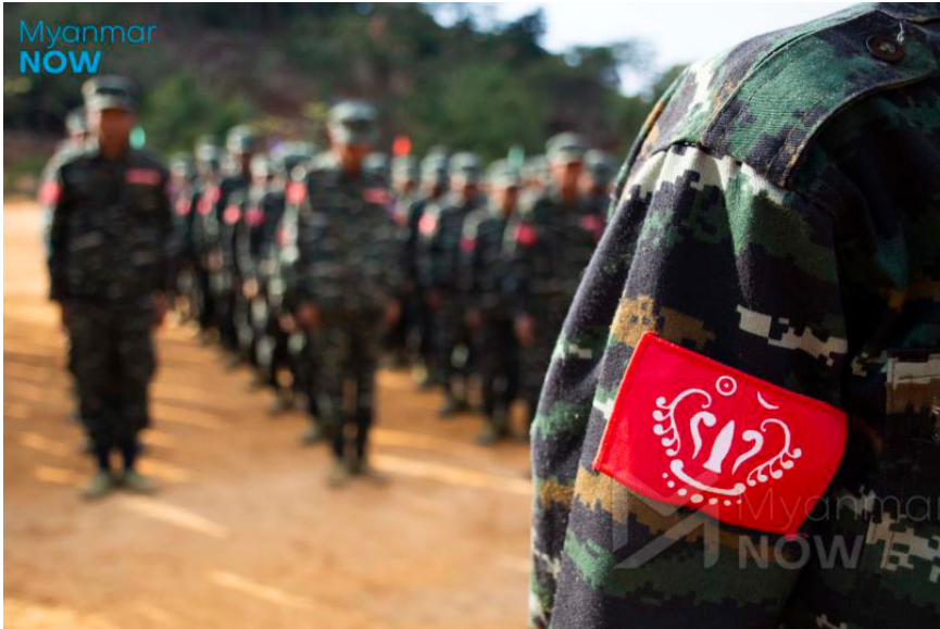
ရက္ခိုင်တပ်တော် (AA) တပ်ဖွဲ့ဝင်များကို ကချင်ပြည်နယ်၊ လိုင်စာမြို့တွင် ၂၀၁၇ ခုနှစ်အတွင်းက တွေ့မြင်ရစဉ်။

ကိုးကား- https://www.myanmar-now.org/mm/news/5469?