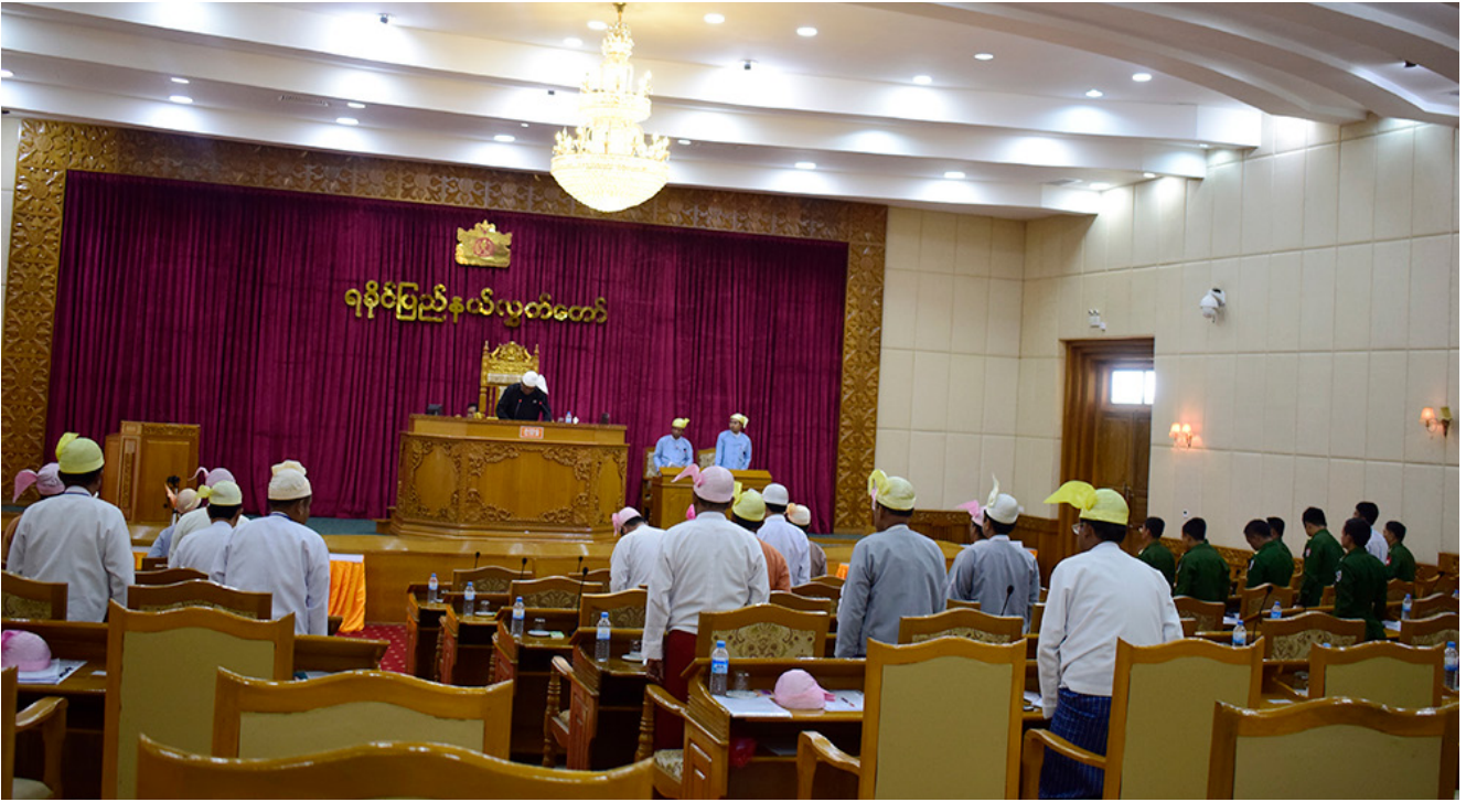
ရခိုင်ပြည်နယ်လွှတ်တော်။