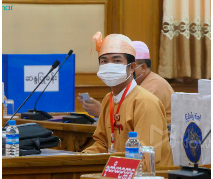
စက်တင်ဘာ ၁ ရက်နေ့ ပြည်နယ် လွှတ်တော်အစည်းအဝေးသို့ တက်ရောက်လာသည့် ကယားပြည်နယ် ဝန်ကြီးချုပ် ဦးအယ်လ်ဖောင်းရှိ